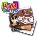
Postkarten für Grund-, Berufs- u. Oberschüler