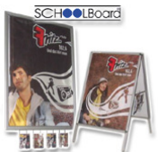
Plakate f. Grund-, Berufs- u. Oberschüler